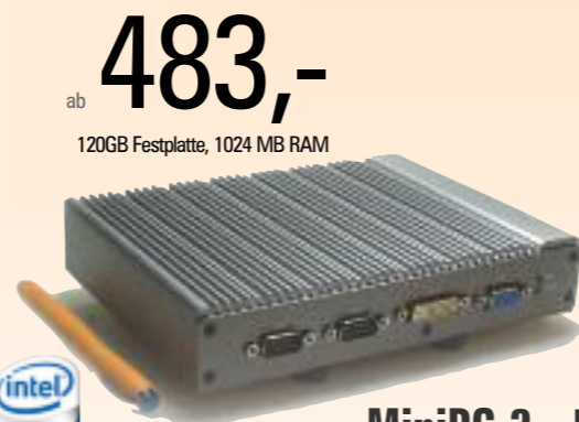
MiniPC 2 - 516

Intel Atom N270 1,6 GHz 1024 max. 2048 MB DDR II RAM 2,5" Festplatte (Option) bzw. 1 GB Flash 4 USB 2.0, DVI, VGA, 2 seriell, 2 LAN, CF-Slot 2x Gigabit LAN 19x14,4x3,6cm