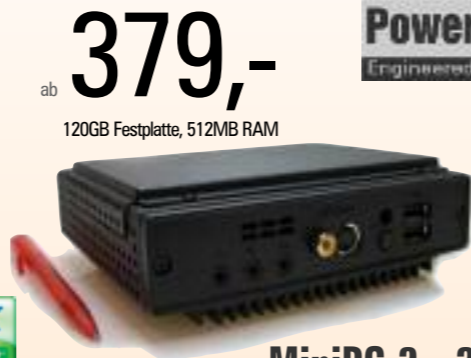
MiniPC 2 - 215

VIA C7 1,5 GHz 512 max. 1.024 MB DDR RAM 2,5" Festplatte (Option) bzw. 1 GB Flash 4 USB 2.0, DVI, VGA Realtek Ethernet (100 Mbps) RTL8139DL 12x13x4,5cm