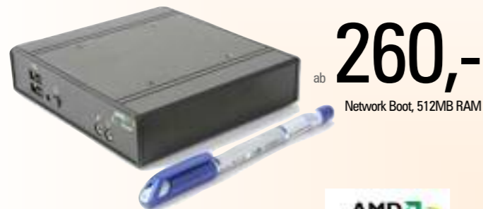
MiniPC 2 - 105

AMD Geode LX-800 Grafik bis 1920x1440 @ 85Hz, Realtek Sound ALC203 (18-bit Voll duplex) 2,5" ATA-Festplatte; 512 MB RAM DDR RAM, max. 1.024 MB 4 USB 2.0, 2 Seriell, 1 Parallel (mit Seriell/Parallel: + 1cm Dicke) Realtek Ethernet (100 Mbps) RTL8139DL 13 x 14 x 3,5 (4,6)cm, 400g; bzw. 13 x 14 x 4,5 (5,5)cm, 660g