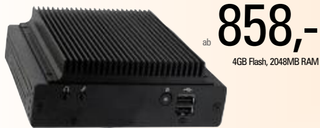
MiniPC 2 - 323

Intel Core 2 Duo 2,26 GHz, Intel GM45 2048 MB DDR II RAM 4 GB max. 8GB Flash 2 USB 2.0, HDMI, VGA, seriell Gigabit LAN 16,5x14x6cm