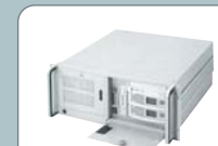
19" Industrial PC