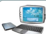
Facebook Tablet PC