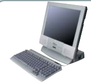
Genius LCD PC