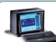
ProMedia Portable PC